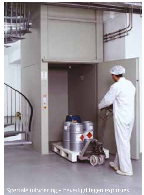
Speciale uitvoering - beveiligd tegen explosies