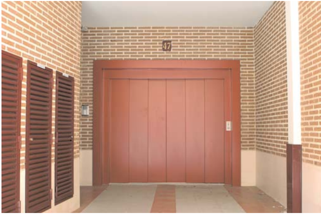
Montacoches en acceso principal de vivienda. Car lift in the main entrance of the building