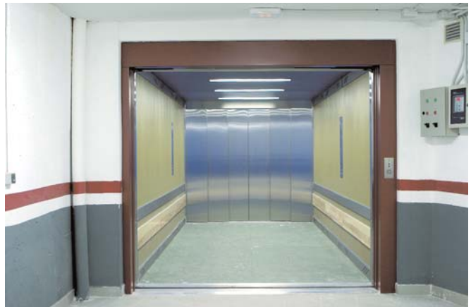
Montacoches de uso privado. Car lift for private use.