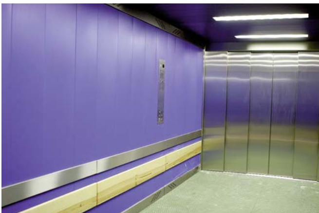
Detalle de acabado de la cabina. Finishing detail of a car.