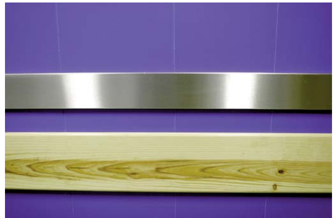
Detalle de acabado para las protecciones laterales del montacoches opcionales en skinplate, acero inoxidable o madera. Details of the side wall protections in the car lift, options are skinplate, wood and stainless steel