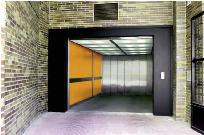
Montacoches en acceso principal de vivienda. Car lift in the main entrance of the building